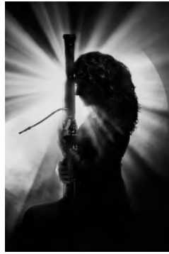
Estelle Richard Basson solo, Orchestre national du Capitole de Toulouse