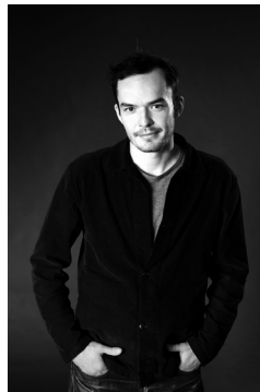
Rodolphe Thery Timbalier solo, Orchestre philharmonique de Radio France