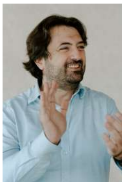
Bruno Mantovani Président du jury Compositeur, chef d'orchestre