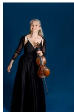
Cordelia Palm Violon super soliste, Orchestre national d'Avignon-Provence