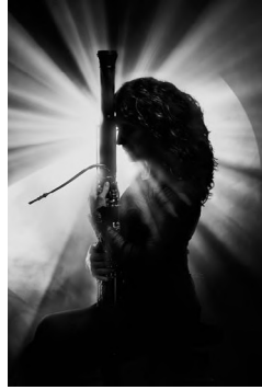
Estelle Richard Basson solo, Orchestre national du Capitole de Toulouse