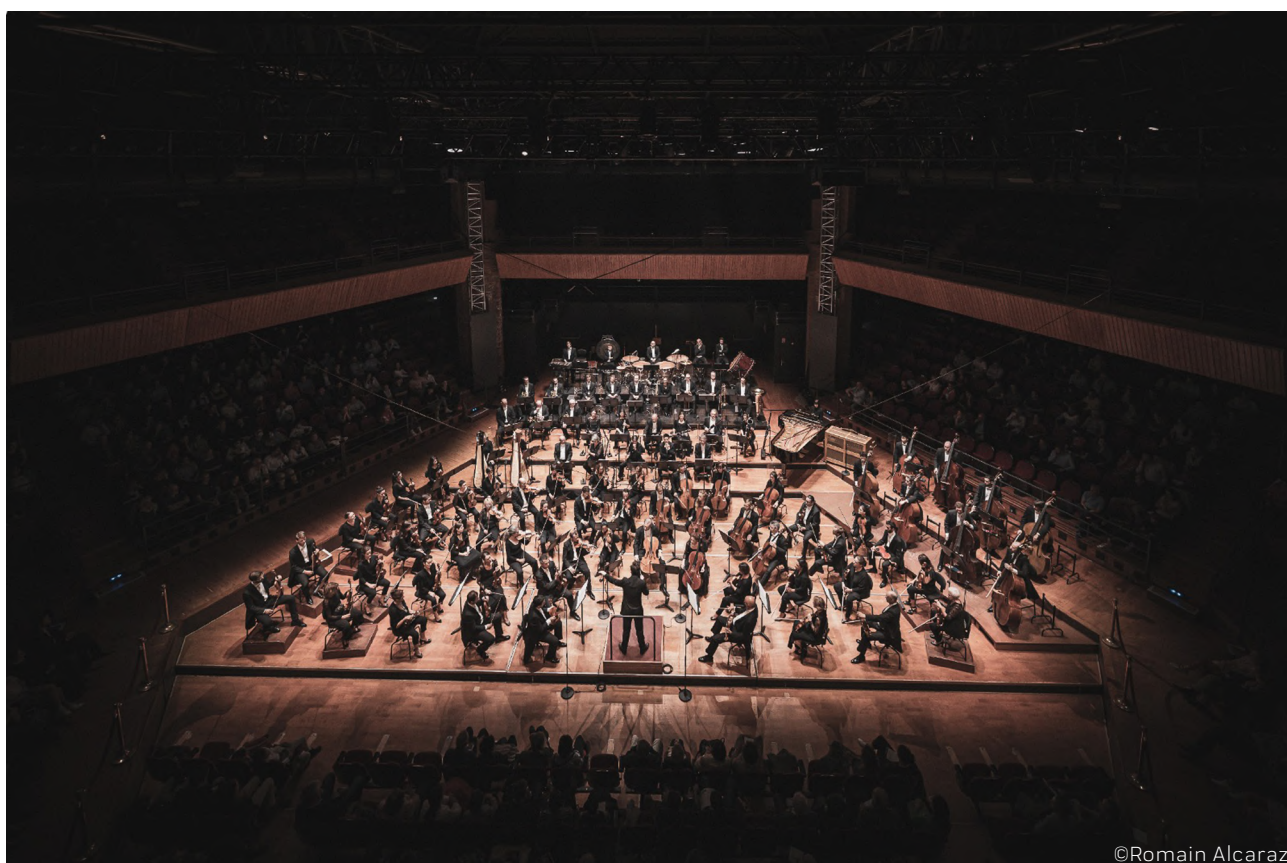
Orchestre national du Capitole de Toulouse